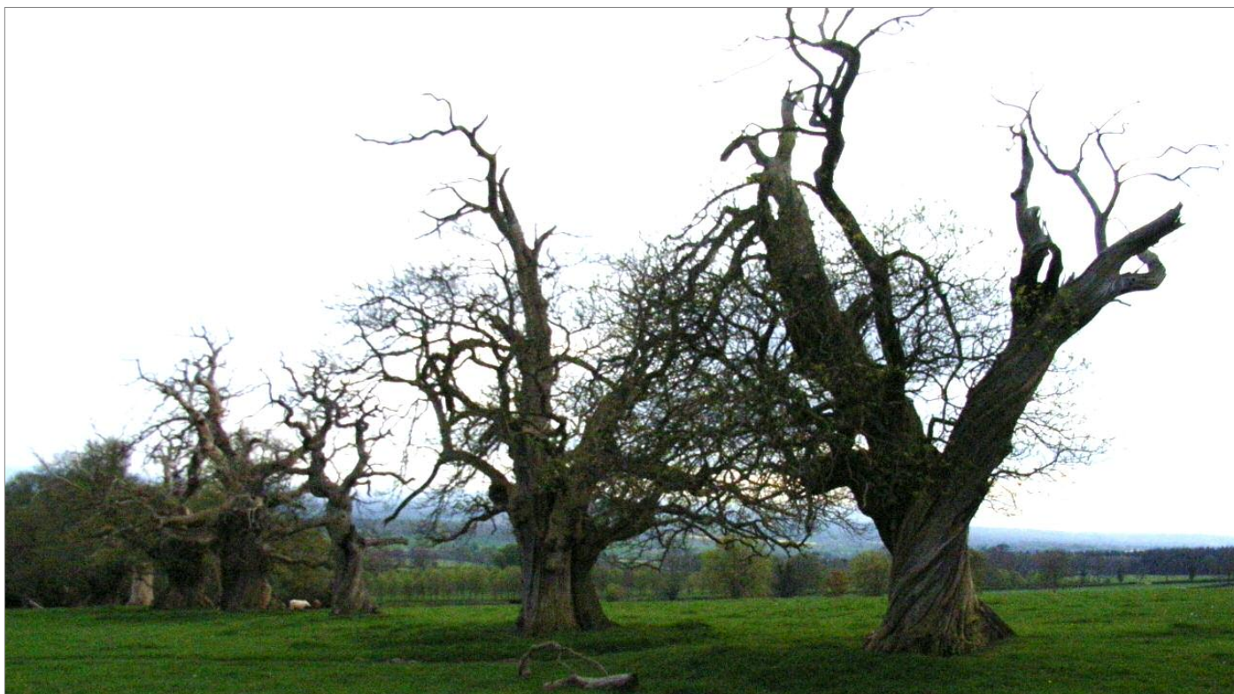
Coed Castan yr Armada, Castell Croft, Swydd Henffordd